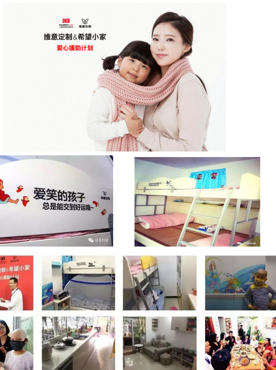
图 7-3 维尚公益行动“希望小家”爱心援助计划

在疫情面前，维尚面对社会需求，第一时间伸出援助之手。1月31日，在中国驻佛罗伦萨总领馆、意大利欧洲青年企业家协会、海外华侨华人帮助下，第一时间从海外筹集1000套防护服，10000个防护口罩急驰武汉防疫一线；2月15日，紧急调拨100台空气净化器，通过阿里巴巴公益捐赠给了武汉抗击疫情一线