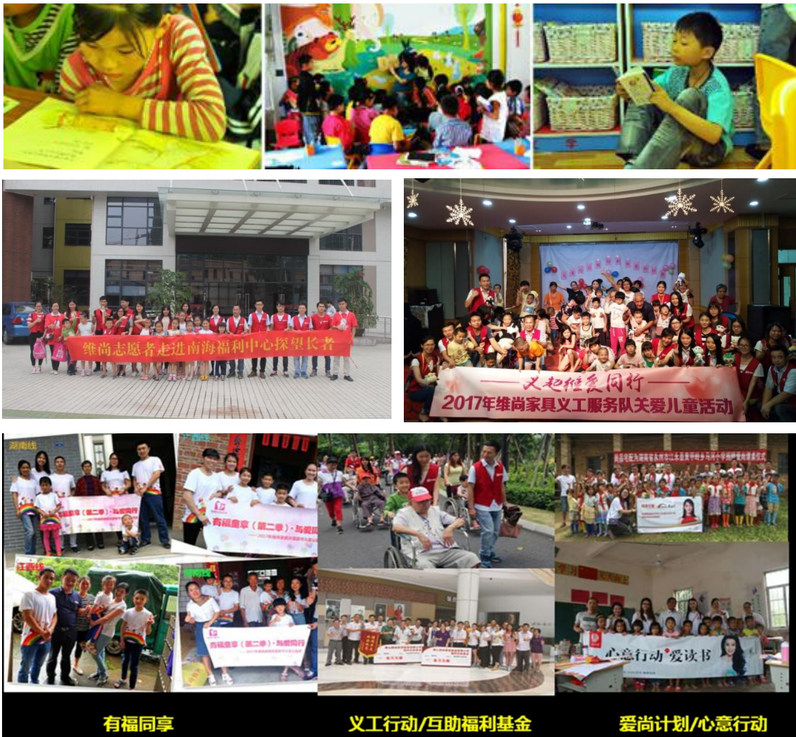
图 7-1 维尚公益活动现场

2013 年，维尚旗下“维意定制”品牌和李冰冰正式签约，聘请李冰冰作为形象代言人的一个重要原因是因为她不仅有很好的公众形象，同时也是一个热心公益的影视明星。签约后，维意定制没有让其过多地参与营销活动，而是让其参与各种公益活动。对此，李冰冰十分赞赏，感觉有遇知音之感。她说：“其实明星代言一个企业，就像是找老公老婆，看中的是爱心和文化。喜欢维意定制家具这