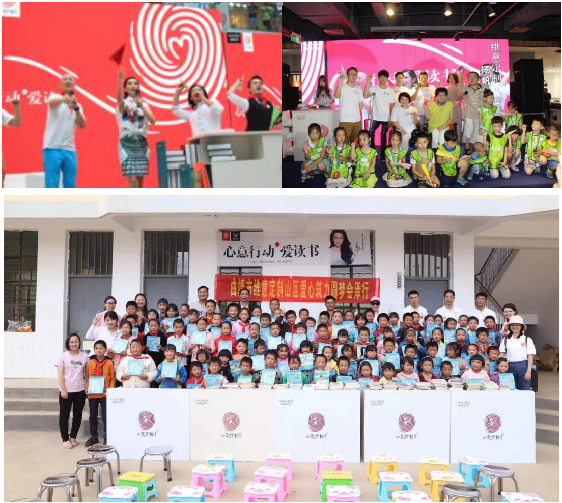
图 7-2 维尚公益心意行动“爱读书”、“爱心企业联盟”等活动

“儿童希望小家”是由儿童希望救助基金会发起的为贫困重患儿童家庭异地就医提供舒适居住环境的一项公益活动。由于大量患儿异地就医增加了治疗成本，给患儿家庭带来负担。因此，维意定制与儿童希望救助基金会合作开展助医工作，在各大医院附近建立了温暖舒适的希望小家，为来自贫困家庭到大城市治疗的病患儿童提供服务，给患儿家庭减轻负担，带去温暖和希望。维意定制无偿为小家提供全套定制家具，用最为专业的设计服务和最环保的板材，让孩子们有更安心舒适的居住环境，目前在广州资助的三间儿童希望小家已经满员，平均每家入住 3~6 户，一间平均一年能够帮助到 10 至 20 户家庭。儿童希望小家专门